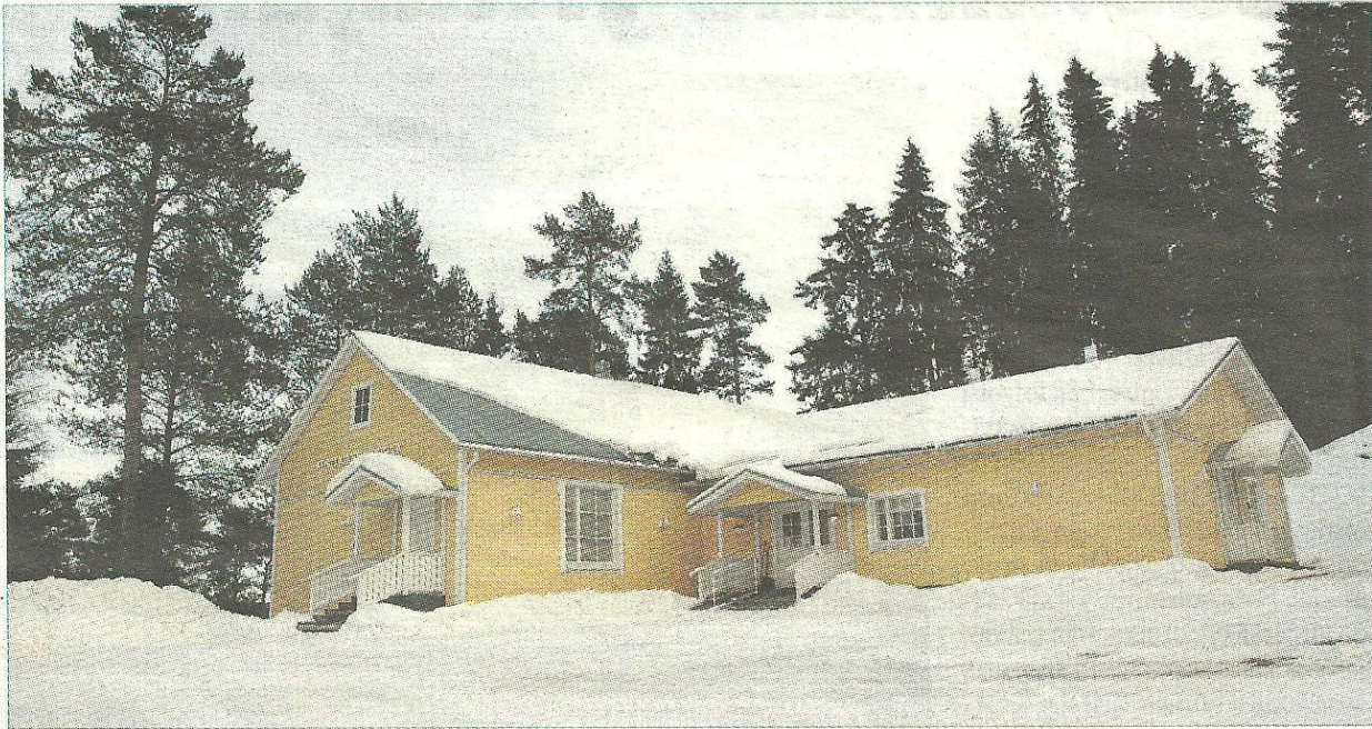
Nousulan kylätalon vanha osa on vasemmalla ja uusi osa oikealla. Talo remontoitiin talkoovoimin.

– Pitoväki on kehunut keittiöpuolta, että se on ti-