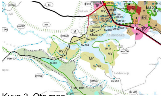
Kuva 3. Ote maa- Kaavamerkintöistä:

Ikaalinen kuuluu Pirkanmaan maakuntaliiton alueeseen. Pirkanmaan 1 maakuntakaava on vahvistettu valtioneuvostossa 29.3.2007. Pirkanmaan 1. maakuntakaava on ns. kokonaiskaava, jossa on tarkasteltu rakentamisalueita, liikennettä, energia-, vesi- ja jätehuoltoa, virkistys- ja suojelualueita, arvokkaita maisema-alueita ja kulttuuriympäristöjä, pohjavesi- ja maa-aineskysymyksiä. Suunnittelualueena on koko Pirkanmaa. Lisäksi kaavassa osoitetaan kehittämisen kohdealueena maakunnan kehityksen kannalta merkittäviä hankkeita / -alueita.