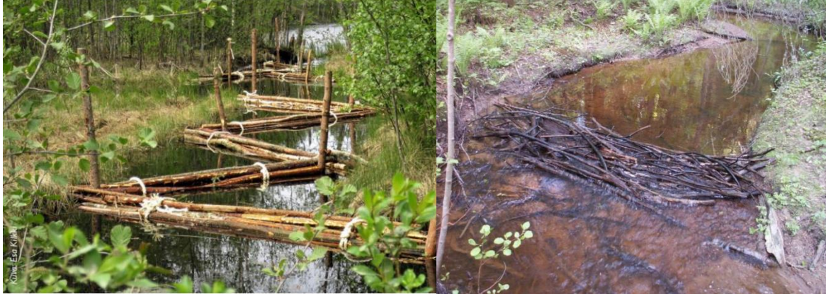
Kuva 1. Vasemmassa kuvassa puurankanippuja metsäojassa (PuuMaVesi – hanke), oikealla kuvassa risupato Keljonpurossa (Jukka Syrjänen)