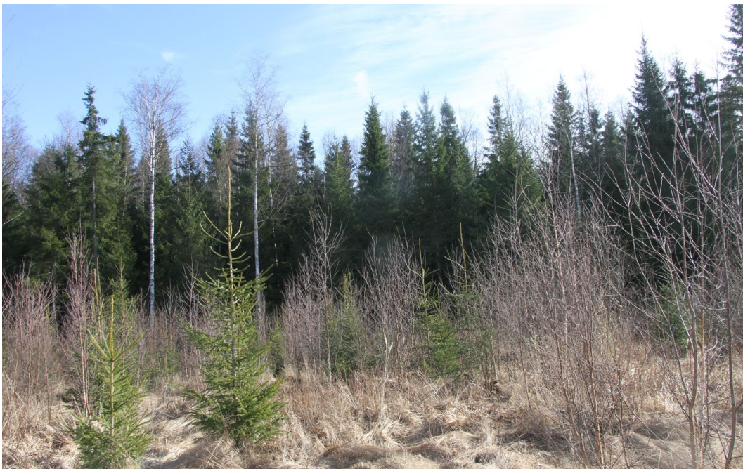
Riihiviidan lähiston vanhan liito-oravan havaintopaikan sekametsää

Tutkimusalueelta (karttaliite 1) tehty liito-oravaselvitys toteutettiin jätöshavainnointimenetelmää käyttäen. Ilmakuva-aineiston perusteella alueelta etsittiin kaikki lehtipuuvallaiset metsäkuviot sekä varttuneemmat metsäkuviot, joissa liito-oravia saattaisi esiintyä. Avohak-