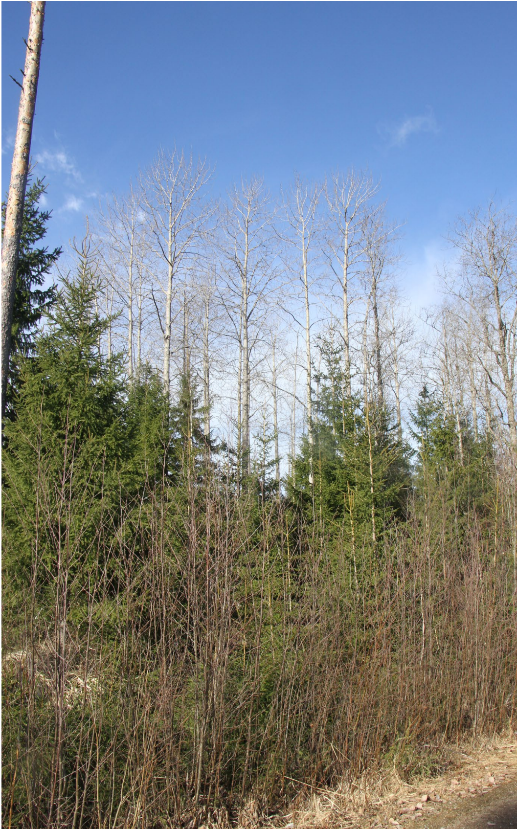
Pölkky sillan vanha liito-oravan havaintopaikan haavikko