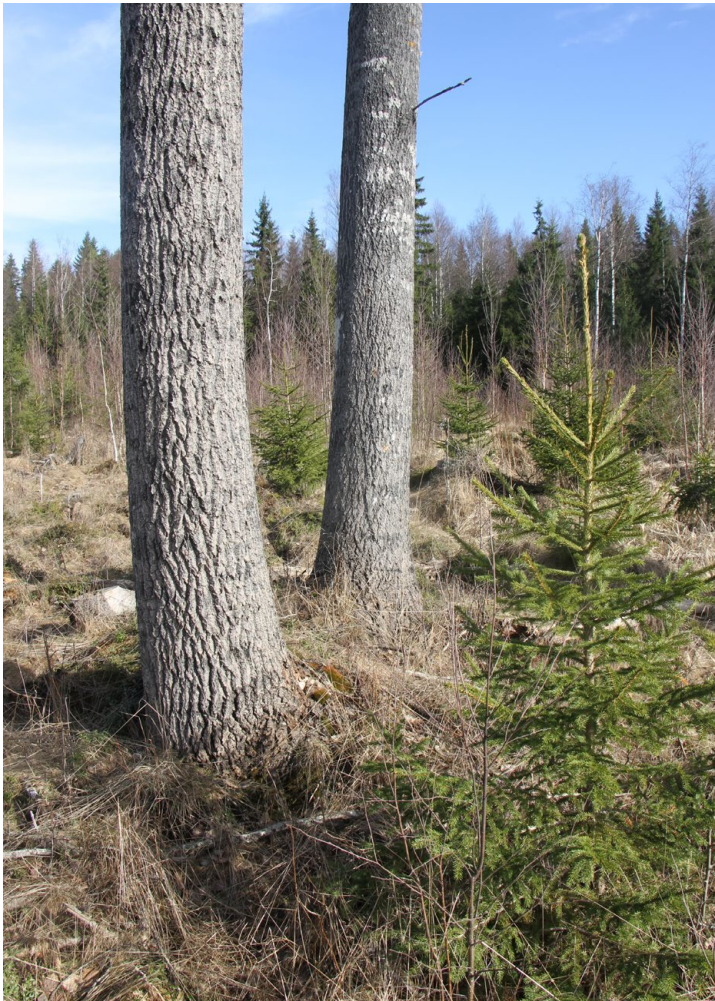
Hakkuaukeiden säästöpuuhaapojen tyvet tarkastettiin liito-oravan jätösten löytämiseksi

Tutkimusalue sijaitsee Ikaalisten kaupungissa, Tevaniemen kylän koillis- ja pohjoispuolella. Valtaosa suunnittelualueesta on metsää, mutta alueella on myös muutamia vesistökohteita ja pienialaisia suokuvioita. Kaikki alueen metsäkuviot ovat talousmetsäkäytössä ja valtaosa alueen metsistä on nuoria taimivaiheen metsiä tai juuri taimivaiheen ohittaneita. Vanhoja metsäkuvioita ei alueella ole ja varttuneitakin metsäkuvioita on niukasti. Metsätyyppi on alueella pääosin mustikkatyyppin kangasta, mutta muutamien kohdoin alueella on karumpia kanerva- ja puolukkatyyppin kankaita. Suurin osa alueen suokuvioista on ojitettu kymmeniä vuosia sitten ja soinen luontotyyppi on muuttunut metsäiseksi luontotyyppiksi. Asutusta tai peltoa ei alueella ole. Alueen eteläosan poikki kulkee Pirkan taival niminen ulkoilureitti.