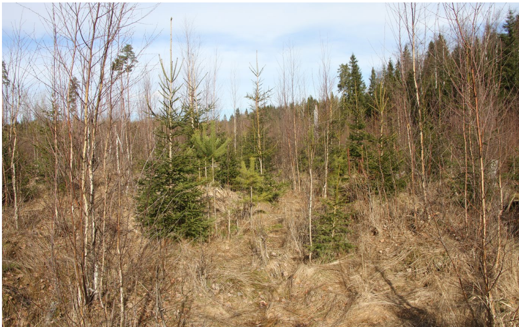
Valtaosa alueesta on liito-oravalle elinympäristöksi sopimatonta taimikkoa tai nuorta metsää

Tutkimusalueella on hyvin vähän liito-oravalle sopivaa elinympäristöä. Koko aluetta on hoidettu talousmetsänä pääosin havupuita suosien, ja valtaosa alueen metsäkuvioista on nuoria ja harvennettuja. Alueella on myös erittäin vähän kolopuita ja lajin ravintokohteina suosimat harmaaleppävaltaiset metsäkuviot puuttuvat alueelta lähes kokonaan. Ylisen Kotajärven itärannalla sekä Pitkäjärven rannoilla on jonkin verran lajille tyypillistä elinympäristöä, mutta näiltä kohteilta ei merkkejä lajista havaittu. Koska koko tutkimusalue on metsää, ei tuulivoimaloiden rakentaminen muodosta lajille liikkumisesteitä. Alueelle rakennettava/kunnostettava tieverkko ei myöskään estä lajin liikkumista alueella.